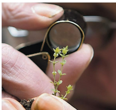
Met een loep wordt het zandmuur be- keken.